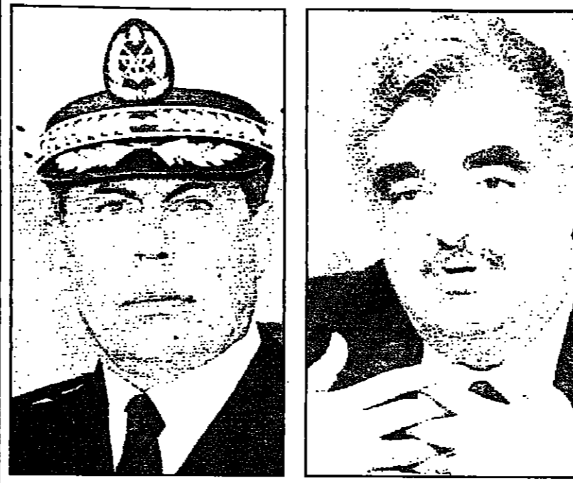
الجنرال عون والجنرال حريري

انتخب في تشرين الثاني (نوفمبر) العام 1989 لولاية أولى من ست سنوات تم تعديدها لثلاث سنوات.